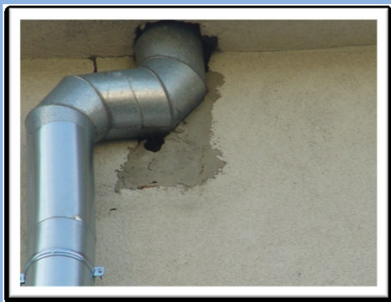
Otwór przy rynnie przy ul. Gdyńskiej