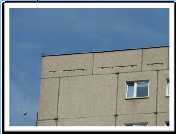
Otwory w stropodachu przy ul. Kijowskiej

Miejscami odpowiednimi do zakładania gniazd przez jerzyki są różnego rodzaju otwory w budynkach, o wąskim na kilka centymetrów wejściu prowadzącym do znajdującej się za nim niszy.