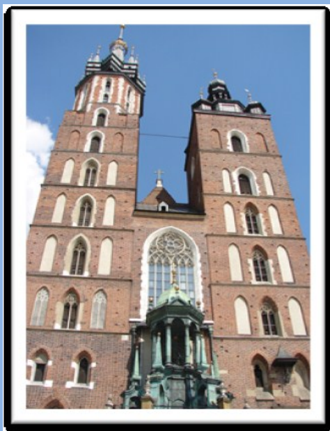
Kościół Mariacki - największa kolonia jerzyków Krakowie i jedna z największych w Europie