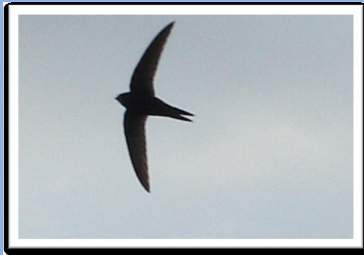
Jerzyk w swoim żywiole

Jerzyki to niezwykle ptaki. Znamy je wszyscy, chociaż często mylimy z jaskólkami. Pojawiają się równo z początkiem maja, wnosząc jako kuzyni kolibrów do naszego miast posmak dalekiej egzotyki. Żadne żywe stworzenie na Ziemi nie lata tak szybko i sprawnie jak one.