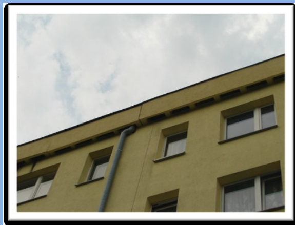
Szczeliny pod dachem na os. Strzelców