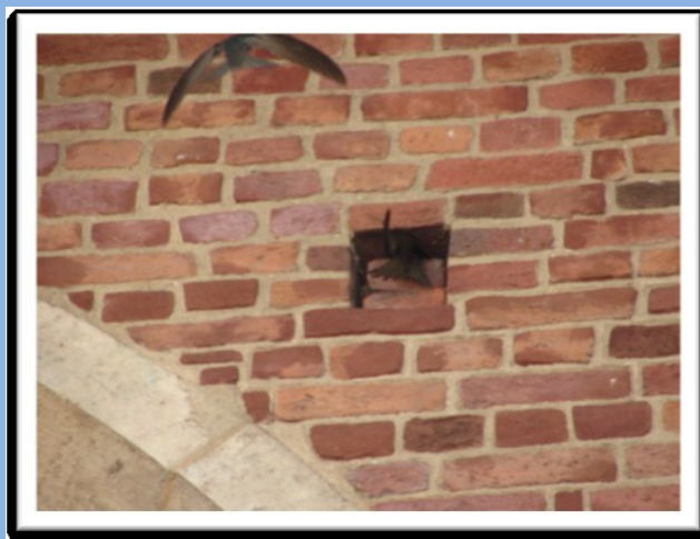
Otwory w ścianach kościoła Mariackiego