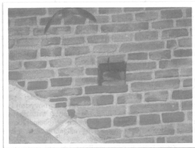
Otwory w ścianach kościoła Mariackiego